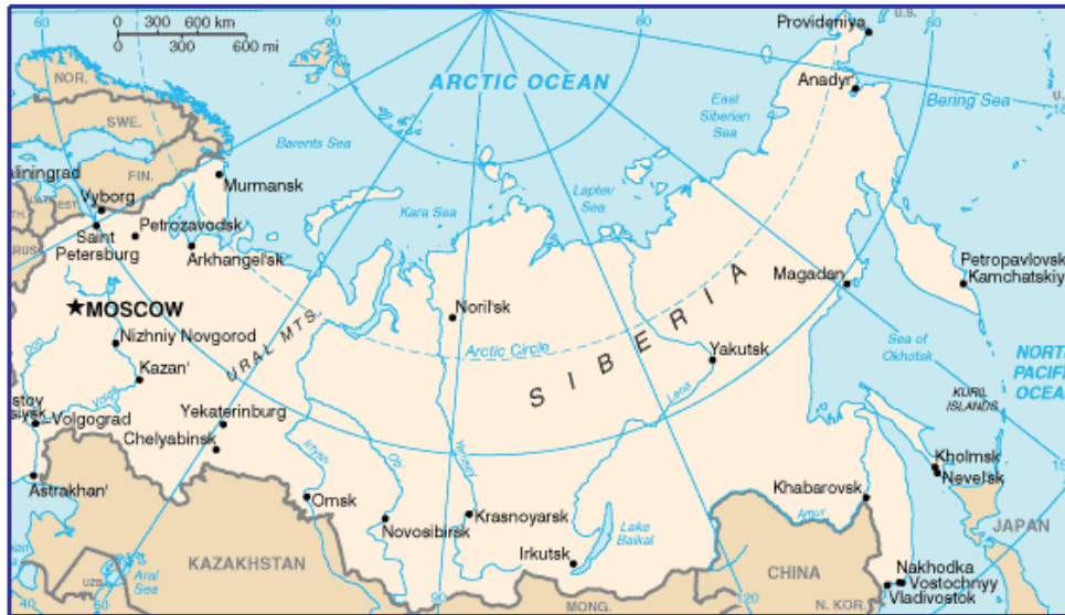
Map from CIA Factbook

دریاچه بایکال در جنوب روسیه عمیق ترین در سراسر جهان است. عمق این دریاچه ۵۳۱۴ فوت (۱۶۳۷ متر) است. کف این دریاچه ۴۲۱۵ فوت (۱۲۸۵ متر) زیر سطح دریا قرار دارد. این دریاچه بزرگ در منطقه فعال ریفت قاره ای قرار گرفته است. تخمین زده می شود که وسعت این دریاچه با سرعتی در حدود ۱ اینچ (۲,۵ سانتیمتر) در سال در حال افزایش است.