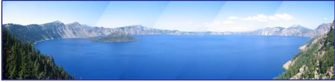
Panorama view of Crater Lake. Note the near vertical cliffs along the margins of the lake.