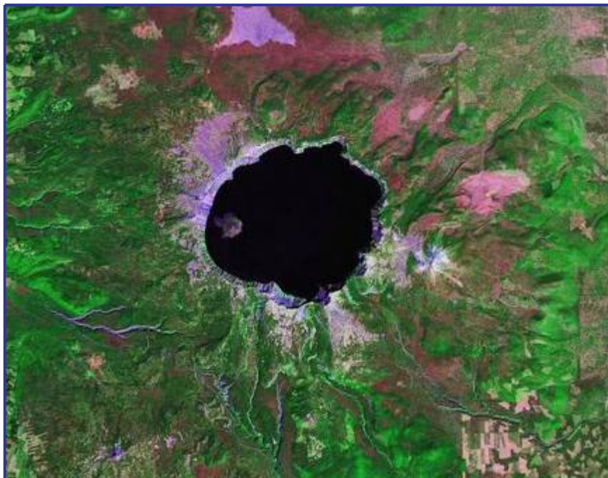
Satellite Image of Crater Lake

دریاچه کراتر، در دهانه یک آتشفشان و در جنوب Oregon قرار دارد. این دریاچه عمیق ترین دریاچه در سراسر آمریکا است. عمق این دریاچه در حدود ۱۹۳۳ فوت (۵۸۹ متر) اندازه گیری شده است.